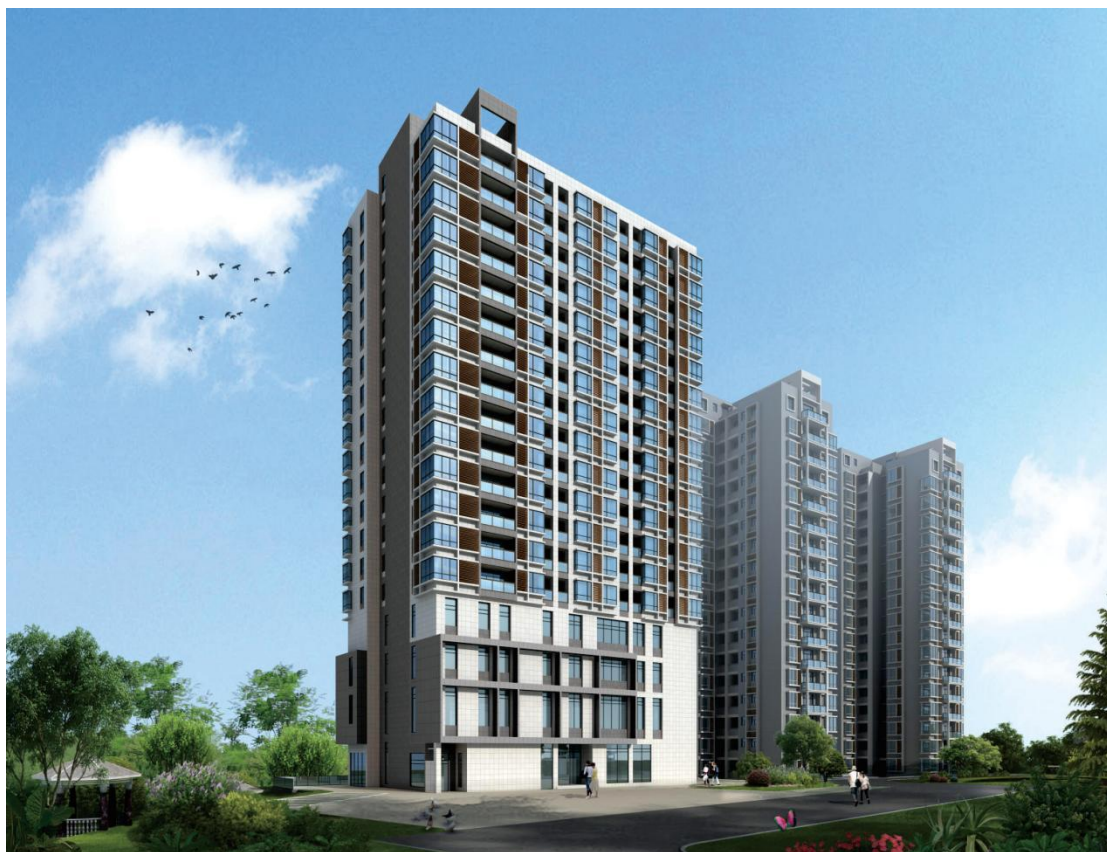
建成后的科教综合科