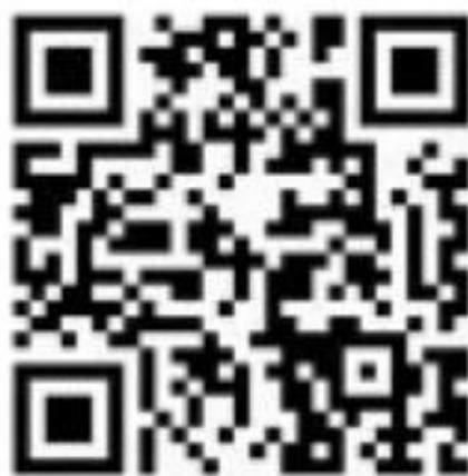
成医附院 2021 年住培报名二维码

2、2021 年度报考成都医学院第一附属医院单位委培住院医师规范化培训报名汇总表