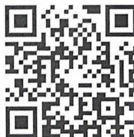
2024 年住培招收报名二维码